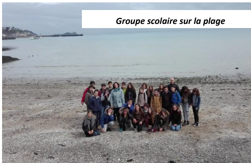
Groupe scolaire sur la plage