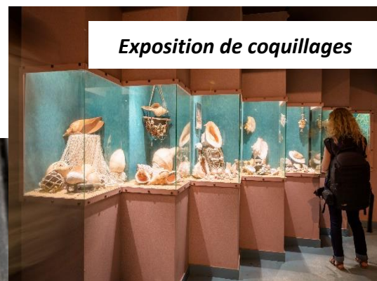
Exposition de coquillages